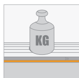
Drukweerstand (CS) ≥ 10 kPa