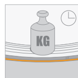
Kruipweerstand (CC) 2 kPa