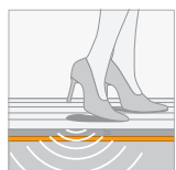
Contactgeluidisolatie (IS) 19 dB ΔLw