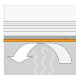
SD Waarde (SD) ≥ 75 m